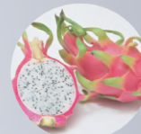
ドラゴンフルーツ