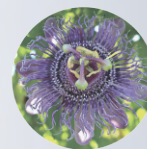
チャボトケイソウ