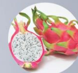
ドラゴンフルーツ