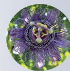
チャボトケイソウ